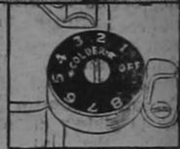
Temperature regulator speeds freezing