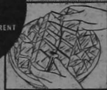
Plenty of ice cubes with Electrolux