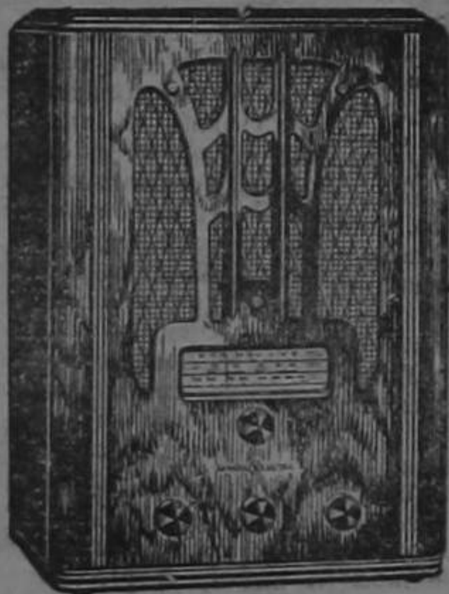
RADIO G. E. MODELO E-81

La rara belleza de sus muebles constituye la nota característica de la serie 1936-1937 de radios General Electric, debida al genio creador del propio estilista de la G. E., uno de los dibujantes industriales de más renombre en los Estados Unidos.